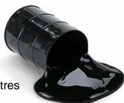
1 baril = 159 litres